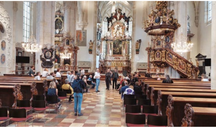
Revitalisierung Grazer Dom